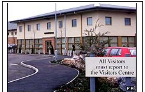
مرکز پناهجویان اخراجی "یارلز وود" در بدفوردشایر انگلستان

یک پسرچه هشت ساله ایرانی از پانزدهم ماه ژوئیه در یکی از مراکز نگهداری از پناهجویان بریتانیا در حبس بوده است. این در حالی است که گفته می شود که میانگین حبس کودکان در این مرکز پانزده روز است. بنا به گزارش روزنامه گاردین، چاپ